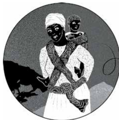
LA VIEILLE DAME et L'ENFANT

Le thème du marimba, quant à lui, incarnera la vieille dame et l'enfant que le héros rencontrera au moment du dénouement de l'histoire.