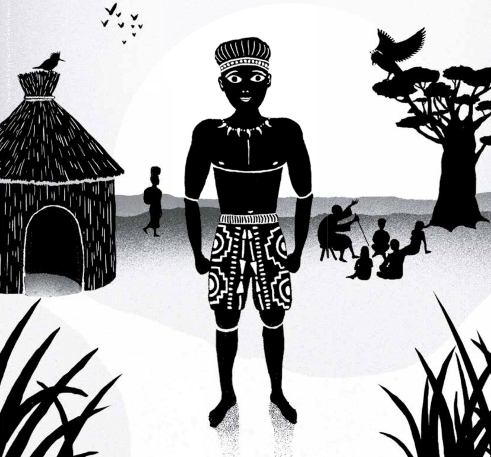
Illustration & graphisme © Yvonne Buffin

SPECTACLE DESTINÉ AUX ENFANTS DE 3 À 10 ANS