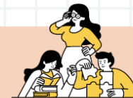
MÊME S'ILS SOULIGNENT DE FORTES DISPARITÉS SUR LES MODALITÉS DE COMMUNICATION SELON LES ENSEIGNANTS

Activités scolaires : 79% de satisfaction